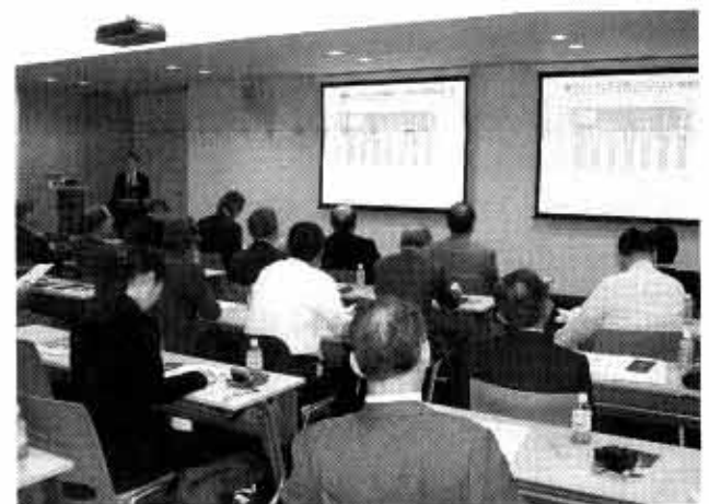
9日にはGC東京幹部を対象にプレゼンを行った